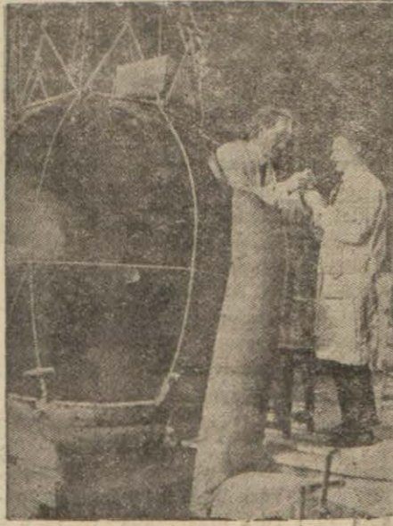
Profesör Ricard hareketten evvel arkadaşına izahat veriyor

"Ancak Avrupa meselesi hallolunduktan sonra umumî sulh beklenebilir. Eger buna irişilemezse, beşeriyetten ümidi kesmek lâzımgelir. Eger esasta mukavelelere hürmet olmazsa, yapılan bütün teşebbüsler beyhude olacaktır."