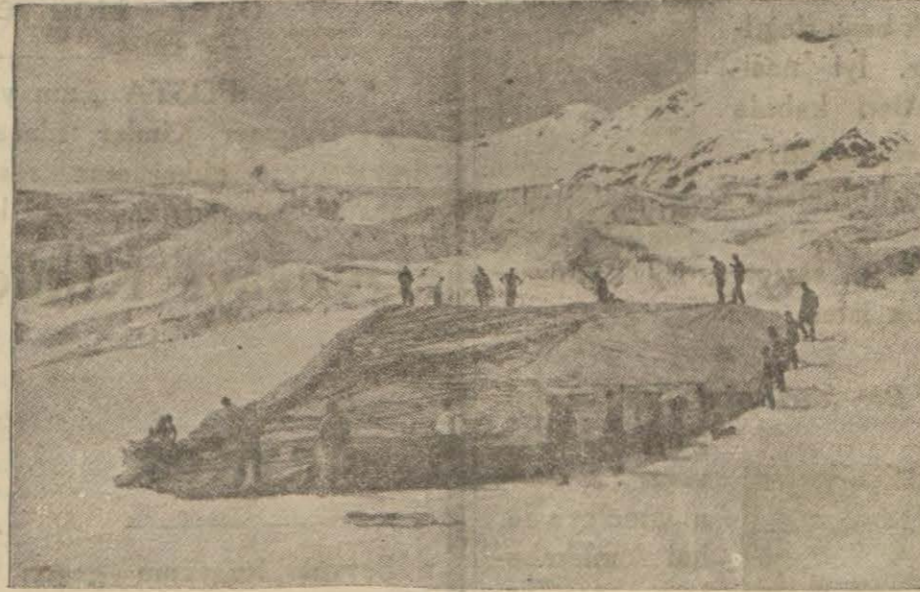
Balon 1600 metreğe çıktıktan 48 saat sonra Tirolda Alp dağlarının eteklerine inmştir. İndikten sonra balon bu şekli almıştır.

Lyon, 8 (A.A.) — M. Herriot dün Rhône sabık muharrirleri ve malûlleri tarafından tertipolunan tezahürde söylediği bir nutukta bilhassa Alman - Avusturya gümrük ittihadı meselesini tetkik ederek devletler arasındaki gümrük manialarının - tıpkı bir termometrenin hastanın ateşini göstermesi, fakat ateşi düşürmemesi gibi - bir sebep değil bir tesirden ibaret olduğunu beyan etmiş ve demiştir ki: