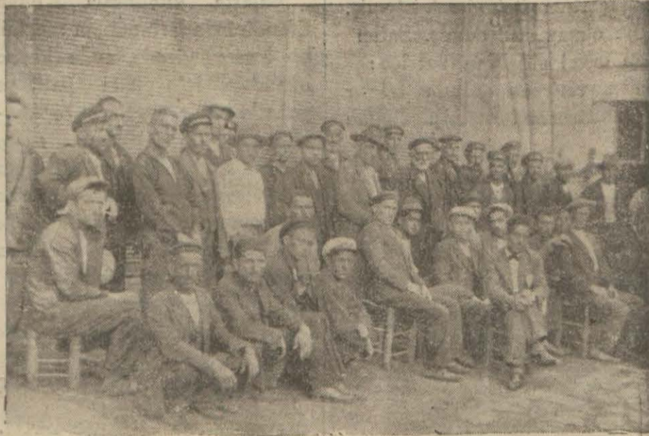
Liman Şirketi ile araları açılan mavnacılar

Liman Şirketi İlk Çekilen Protestoya Hiçbir Cevap Vermemiştir.