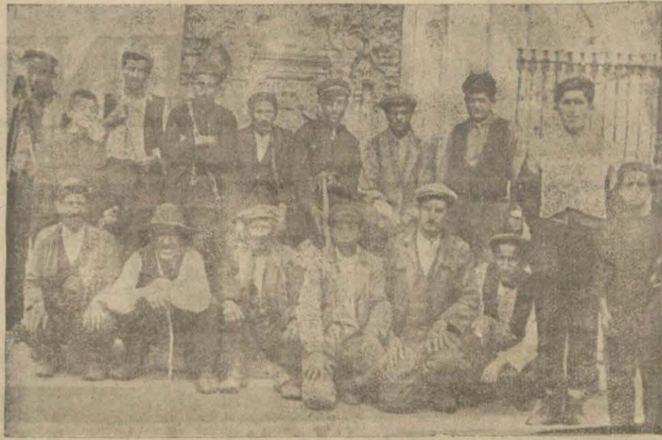
Hüviyet cüzdanlarından el'aman çeken sakalar

Esnaftan hüviyet cüzdanları meselesi bir mesele, bir dert oldu. Bütün esnaf bu cüzdanları dağıtanlardan şikâyet ediyorlar ve diyorlar ki: